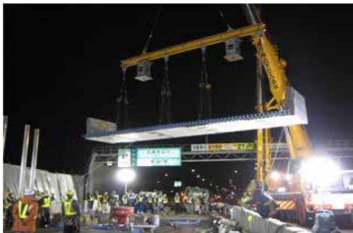
新しい床版の設置作業