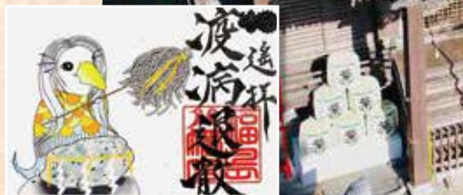
アマビエの足元に疫病を鎮める祈願石が描かれた「疫病退散特別御朱印」1,000円

神社仏閣を訪れる新たな楽しみとして定着した「御朱印」。最近では登城の記念にお城でいただける「御城印」も登場し、注目を集めています。疫病退散の願いを込めて「アマビエ」が描かれたものや、3密を避けるためオンラインで授与してもらえるものなど、今年ならではの御朱印・御城印を紹介します。