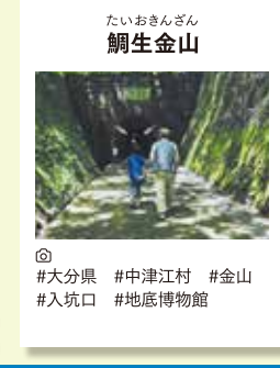
たいおきさん 鯛生金山