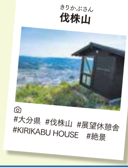
きりかぶさん 伐株山