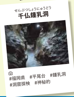
せんぶつしょうどう 千仏鍾乳洞

取材先で見つけたフォトジェニックスポットです。訪れた際、ぜひ探してみてください。