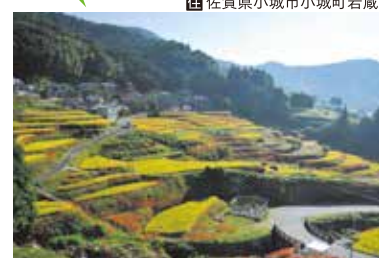
えりやま たなだ 江里山の棚田

標高250mに位置する江里山地区は、米やみかんなどを中心とした農山村の棚田地域。9月下旬になると彼岸花が咲き誇り、田園風景を鮮やかに飾ります。四季を通して様々な景観が眺められ、「農村景観百選」や「日本の棚田百選」などに選ばれています。