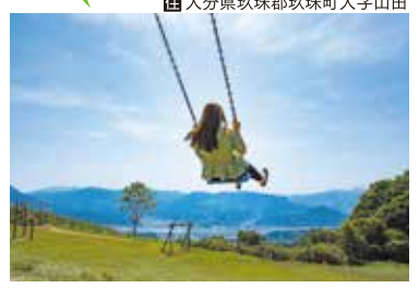
きりかぶさん 伐株山

大男が巨大な楠を切り倒してできたという伝説が残る伐株山。町のシンボルとして親しまれ、頂上からは美しい玖珠盆地が一望できます。遊具なども設置されており、中でも絶景に向けて飛び出す「ハイジブランコ」はフォトスポットとしても人気を集めています。