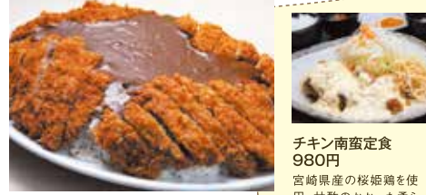
チキン南蛮定食 980円

宮崎県内のお土産を豊富に取り扱う霧島SA(上り)では、レストランの人気メニューを霧島連山に見立てたメガ盛りメニューを提供しています。新燃岳に見立てた黒豚カツカレーは、1kg(6.7合)のライスに4枚のカツをのせた驚きのボリューム! 20分以内の完食を目指そう!