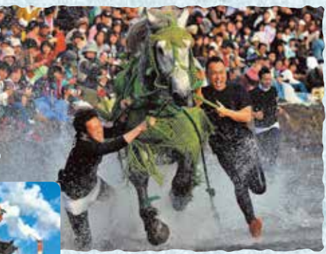
水しぶきを上げながら人馬一体となって走る「馬追い」は迫力満点!

九州三大祭りの一つとされ、ユネスコ無形文化遺産にも登録されている八代妙見祭。見どころとなるのは、約1,700人が列をなす23日の神幸行列。塩屋八幡宮から八代神社までの約6kmの道のりを、豪華絢爛な笠鉾や獅子など40の出し物とともに練り歩きます。砥崎河原では行列の紹介のほか、獅子や亀蛇の演舞、馬追いなどが披露されます。